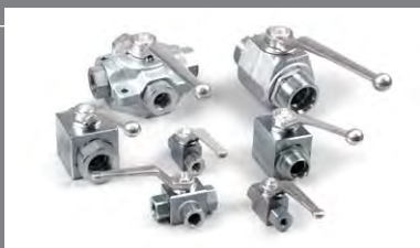
8 Kulové ventily