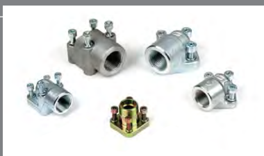
11 Přípojky pro hydraulická čerpadla