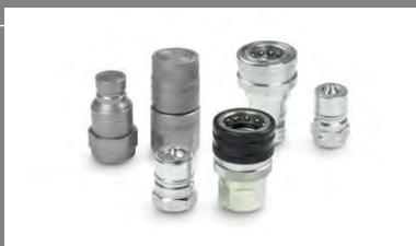
14 Hydraulické rychlospojky