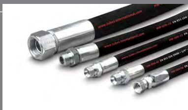
4 Pryžové a termoplastové hydraulické hadice