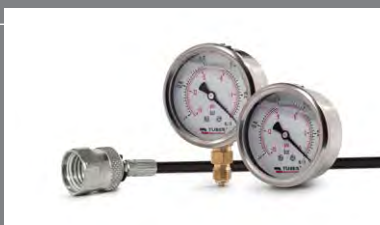
5 Měřicí systémy