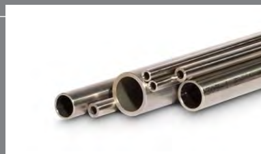
12 Přesné bezešvé hydraulické trubky