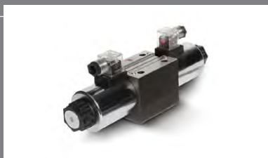
13 Ventily pro montáž na desky