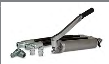
2 Mazací technika