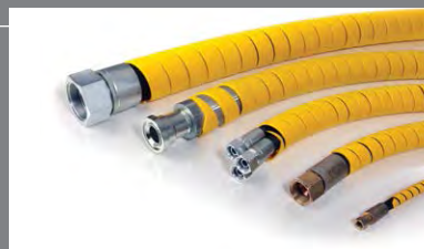
9 Ochrany a zabezpečení