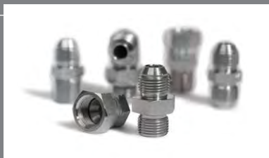
16 Hydraulické adaptéry a spojky