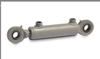
17 Hydraulické válcce