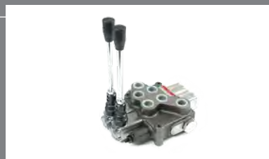
3 Vícesekční hydraulické rozvaděče