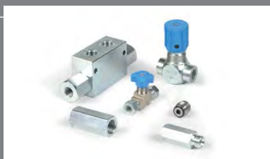
10 Řídící ventily