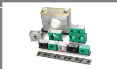
6 Objímky pro upěvnění hadic a trubek