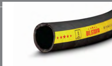
15 Tlako-sací hadice pro čerpadla