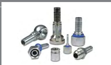
7 Koncovky pro hadice