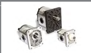
1 Zubová čerpadla